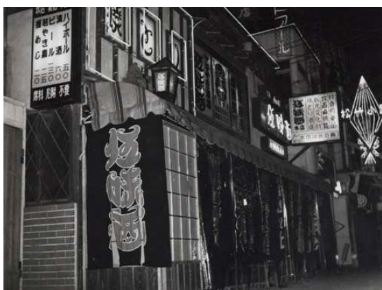
松竹小路入口の元伍味酉・南呉服町一丁目、昭和30年代当時、現在は丸栄南館