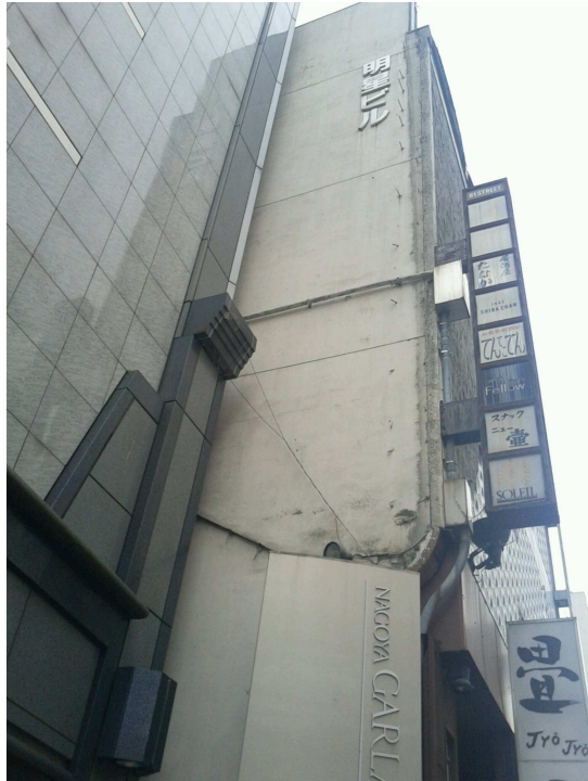
B1 ストリート明星ビル